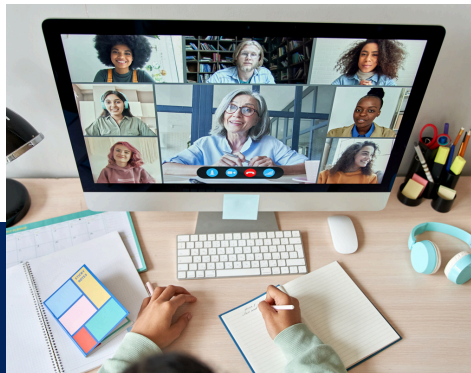
FOUNDATION/ INDUCTION (3 HRS)