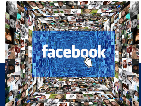
META ADVERTISING & CAMPAIGN MANAGEMENT LAB (6 HRS)