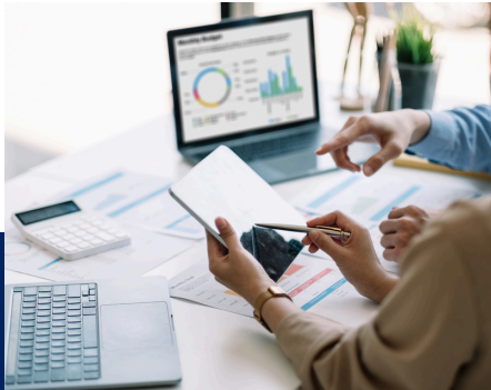
MARKETING ANALYTICS (3 HRS)