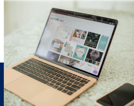
CANVA WORKSHOP (3 HRS)