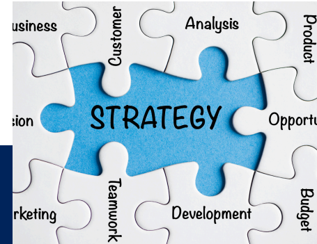
DIGITAL STRATEGY (3 HRS)