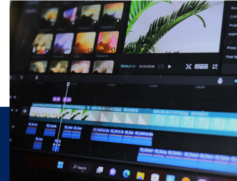
VIDEO AND STORIES CREATION (3 HRS)

ONE TO ONE MEETINGS FOR DIGITAL STRATEGY (3 HRS)