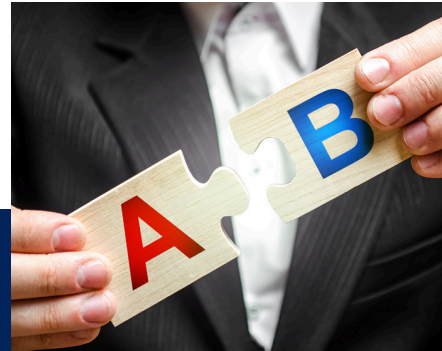
A/B TESTING (3 HRS)