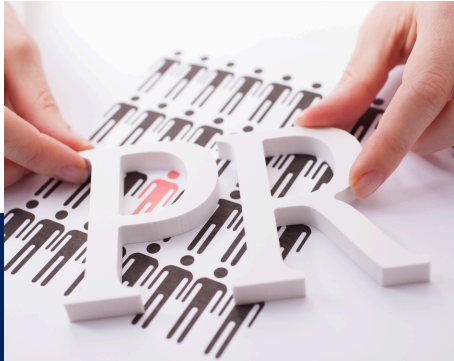
STRATEGIC DIGITAL PR (3 HRS)