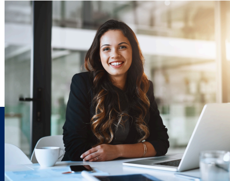
CAREER DEVELOPMENT WORKSHOP (2 HRS)