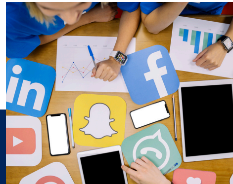
SOCIAL MEDIA & CONTENT MANAGEMENT (6 HRS)