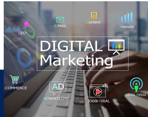
THE WORLD OF DIGITAL MARKETING (3 HRS)