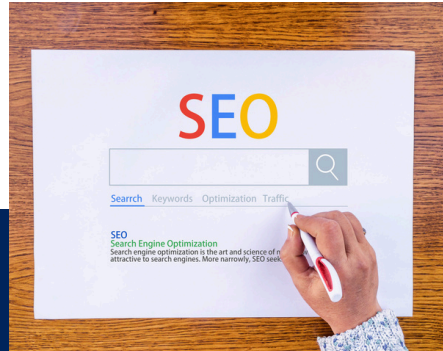
SEARCH ENGINE OPTIMIZATION (SEO) & GOOGLE OPTIMIZATION (3 HRS)